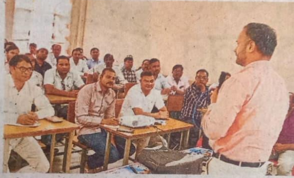
बारां. व्यवस्थाओं का अवलोकन करते जिला निर्वाचन अधिकारी।