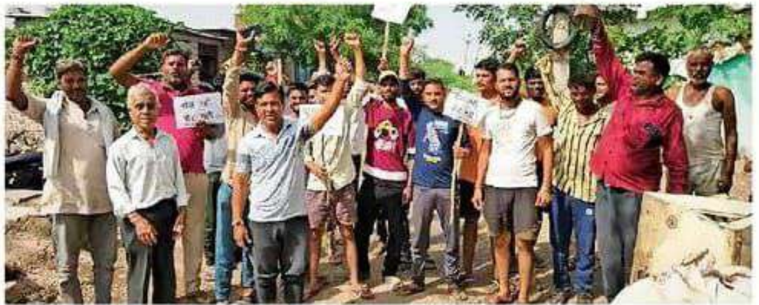
बारां. खस्ताहाल सड़क की समस्या को लेकर आक्रोशित ग्रामीणों ने किया प्रदर्शन।

ग्रामीणों ने बताया कि समस्या को लेकर कई बार जनप्रतिनिधियों, पूर्व विधायक, मंत्रियों, सांसद, अधिकारियों को अवगत कराया जा चुका है, लेकिन ग्रामीणों को अब