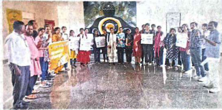
बारां. उत्साह के साथ लिया मतदान का संकल्प।

अंता के राजकीय महाविद्यालय में कार्यक्रम के दौरान विद्यार्थियों ने आकर्षक मेहंदी में निर्वाचन के ऑनलाइन एप्लीकेशन वोटर हेल्पलाइन, सी विजिल व सक्षम ऐप को दर्शाते हुए तथा '11 नवंबर नोट करें निर्भय होकर वोट करें', 'उम्र 18 खुशी अपार, नाम जुड़ेगा पहली बार'