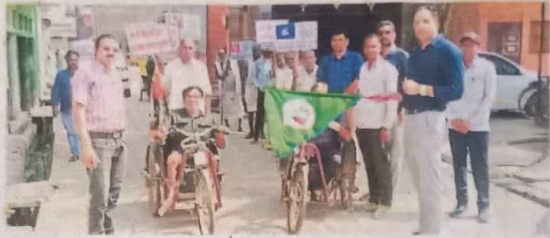
मांगरोल. दिव्यांगजनोंने जागरूकता रैली निकालकर लोगों को प्रेरित किया।

रैली के दौरान दिव्यांगजन हम भी पीछे नहीं रहेंगे, मत देकर सरकार चुनेंगे सारे काम छोड़ दो, सबसे पहले वोट दो नारो का उद्घोष करते हुए