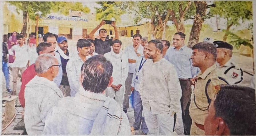
बारां. मतदान केंद्रों का निरीक्षण करते कलक्टर और एसपी।