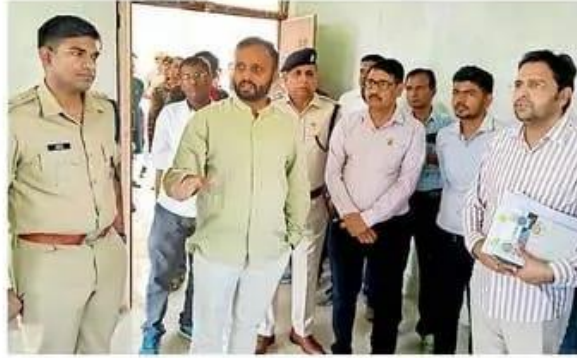
बोहत. कस्बे में पोलिंग बूथ का निरीक्षण करते हुए कलेक्टर और एसपी।

इस दौरान अधिकारियों ने मतदान केंद्रों की व्यवस्थाओं का जायजा लिया और उपचुनाव में मतदाताओं को निर्भीक होकर मतदान करने का संदेश दिया। साथ ही उन्होंने ग्रामीणों से संवाद करते हुए डीएपी खाद की उपलब्धता के बारे में जानकारी ली तथा किसानों को एनपीके खाद का उपयोग बढ़ाने के लिए प्रेरित किया। इस मौके पर अंता