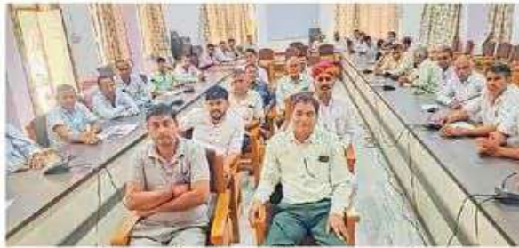
मकराना. पुनरीक्षण कार्यक्रम में भाग लेते सुपरवाइजर व अधिकारी।