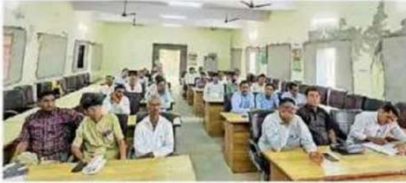
बालोतरा . एक दिवसीय प्रशिक्षण कार्यक्रम के दौरान मौजूद अधिकारी।

इस कार्यशाला के माध्यम से निर्वाचन विभाग राजस्थान के निर्देशानुसार विशेष गहन पुनरीक्षण कार्यक्रम 2025 के तहत नवीनतम दिशा-निर्देशों के अनुसार निर्वाचन कार्मिकों की क्षमता संवर्द्धन किया गया। प्रशिक्षण सत्र के दौरान दक्ष प्रशिक्षकों की ओर से प्रतिभागियों को मतदाता सूची के शुद्धिकरण, नए मतदाताओं के पंजीकरण, नामों