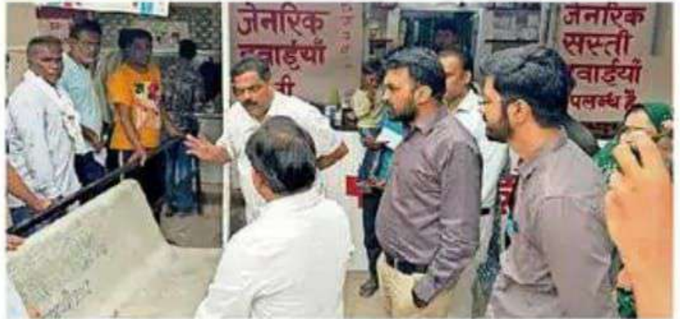
लाडनू अस्पताल का निरीक्षण करते कलेक्टर।