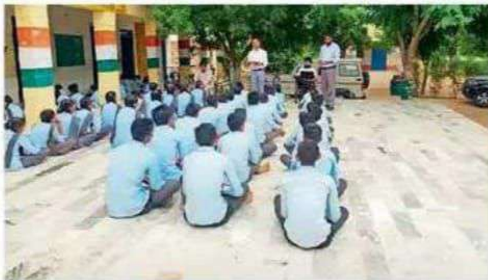
पाटोदी. मतदान साक्षरता क्लब का गठन करते हुए।

मतदाता जागरूकता को बढ़ावा देने के लिए एक मतदाता साक्षरता क्लब का गठन किया गया। इस क्लब में कक्षा 11 के एक छात्र को