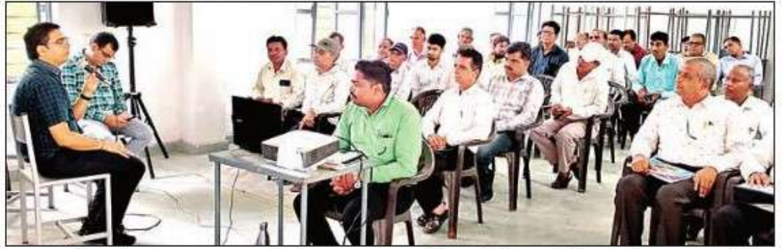
डूंगरपुर। बीएलओ एवं सुपरवाइजर का विशेष गहन पुनरीक्षण प्रशिक्षण के दौरान संबोधित करते हुए।-मयंक चौबीसा

उन्होंने प्रशिक्षण में उपस्थित सभी बीएलओ एवं सुपरवाइजर को कहा कि विशेष गहन पुनरीक्षण का मुख्य उद्देश्य है कि विधानसभा में नियुक्त बीएलओ एवं सुपरवाइजर द्वारा मतदाता नामावली को पूरी तरह से जांचने की प्रक्रिया है, जिसमें सभी पात्र मतदाताओं के नाम को सूची में शामिल करने और अपात्र नाम को