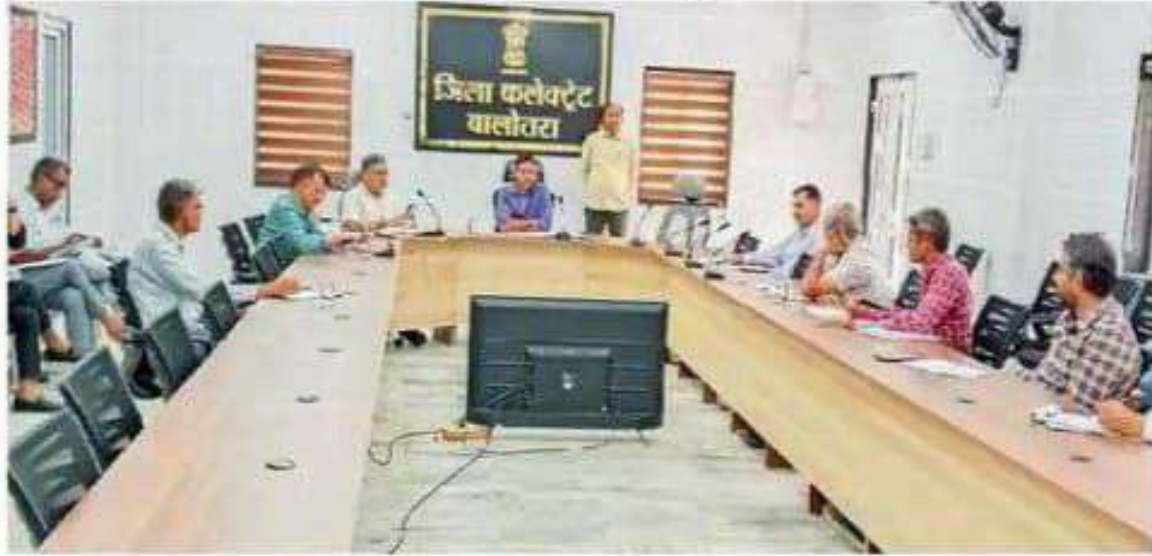
बालोतरा . कलेक्ट्रेट परिसर में पुनरीक्षण कार्यक्रम पर राजस्व अधिकारियों से चर्चा करते कलेक्टर।